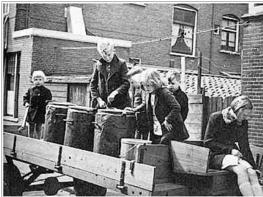
Kinderen schrapen de laatste restjes uit de gamellen bij de gaarkeuken.